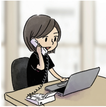
様々な経験を持つ社会福祉士、精神保健福祉士がサポートいたします。

「こんな症状だけど訪問診療は受けられる?」「在宅医療のサービスを受けたいけれど、お金が心配…」など、不安なことや分からないことを、専門の医療ソーシャルワーカーに無料でご相談いただけます。